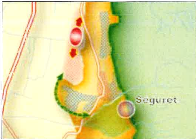
Extrait du SCoT existant