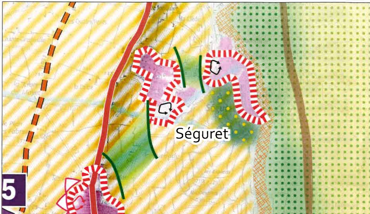
Extrait du SCoT arrêté le 28/08/2020

Dans le projet SCoT qui a été arrêté le 28/08/2020, les souhaits de la Commune de Séguret ont été pris en compte, notamment le développement vers le sud de notre enveloppe urbaine, et nous vous en remercions.