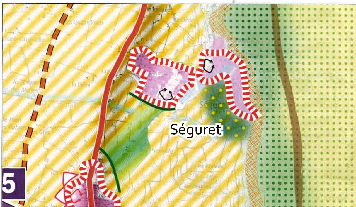
Proposition d'évolution du DOO avant approbation

En conséquence, je vous demande par la présente de bien vouloir modifier le SCoT avant approbation en évoquant le comblement de l'espace situé au nord du chemin de Sous Cabasse, entre les quartiers de Saint Joseph et La Combe . Il ne s'agira pas forcément de créer un quartier très dense au regard des enjeux paysagers (à voir s'il faut l'inscrire comme secteur stratégique ?).